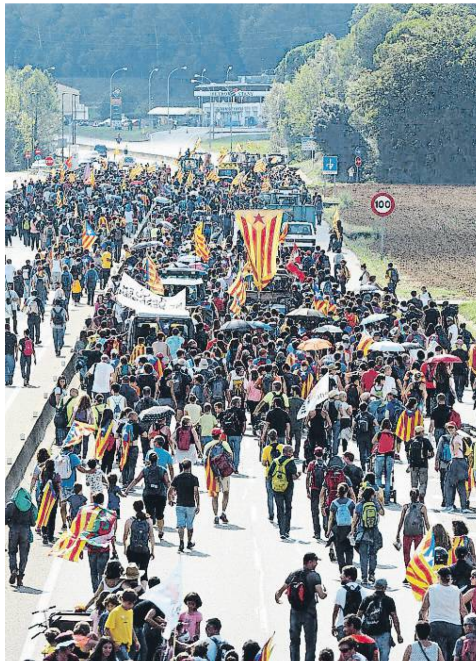
PERE DURAN / NORD MEDIA